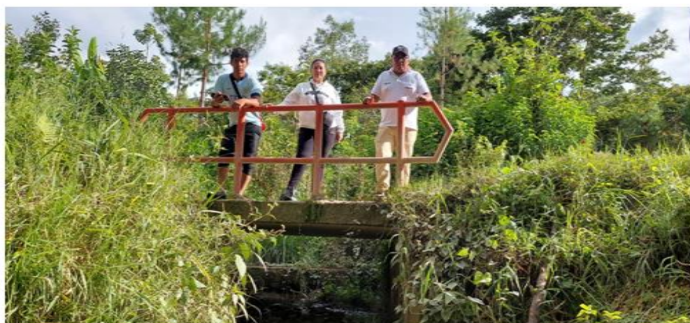
FIGURA N°02: TRAMO DE LA QUEBRADA DONDE SE PRODUCE DESBORDE, GENERANDO INUNDACION DE LOS CAMINOS VECINALES DEL SECTOR