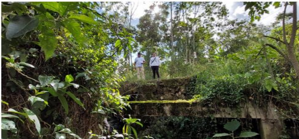
FIGURA N°01: TRAMO CRÍTICO DE LA QUEBRADA RAMO, SE REQUIERE LIMPIEZA Y DESCOLMATACION PARA SU MANTENIMIENTO.